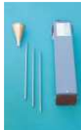
Horchdose zur Armaturen- inspektion