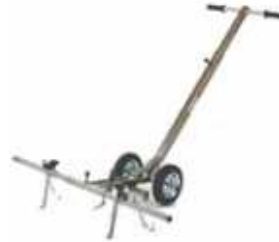
Kawag aus Edelstahl Spezialdeckelwagen hebt Schachtdeckel bis 80 kg