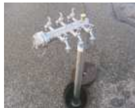
Logopipe Einfaches Standrohr -Edelstahl-