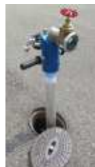
Ultra Leichtes Alu Sicherheitsstandrohr mit RV u. Belüfter