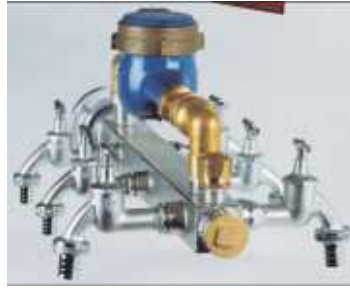
Zapfhahnatterie als Verteiler zum Anschluss an C-Storz Kupplung -Edelstahl-