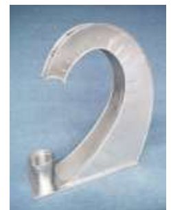
Aquafant Trinkbrunnen "Elefantenrüssel" -Edelstahl-