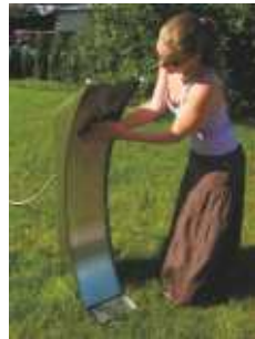
Rondolino Trinkbrunnen mit Tastventil -Edelstahl-