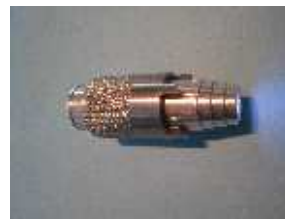
Easyschaver Dichtflächenreiniger für Verschraubungen u. Zähler diverse Größen