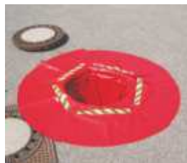
Poncho Schachteinstiegschürze verhindert Kleiderverschmutzung