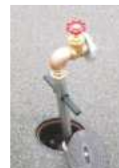
Simplex Einfaches Spülstandrohr -Edelstahl-