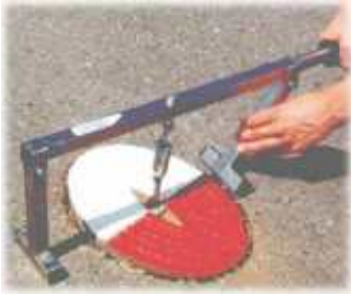
Herkules Deckelheber aus Edelstahl