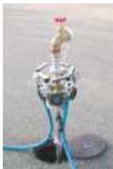
Aquabenz 5-fach-Verteilerstandrohr mit Einzelzählern & Einzelsystemtrennern, einzeln abschließbar -Edelstahl-