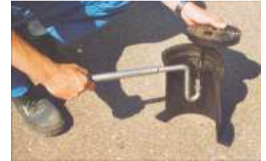
Bogenschlüssel inkl. Doppelnuss SW 17 u. 19