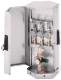
Plaza Wasserversorgungspoller -Edelstahl-