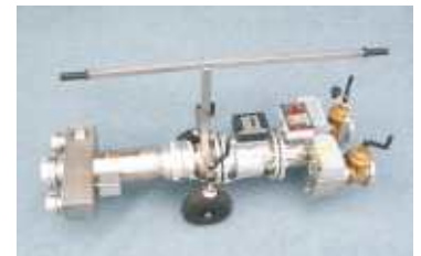
Gigaflow für die Durchflussmessung bis 500 cbm/h