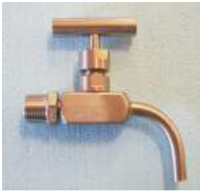
Edelstahl Probeentnahmeventil Nadelventiltechnik Gewindegröße 1/2"