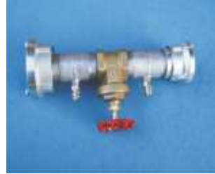
B-C Probeset mit Storzkupplung