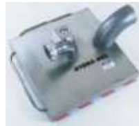
Hydrabox stabilisiert C- oder B- Schlauch -Edelstahl-