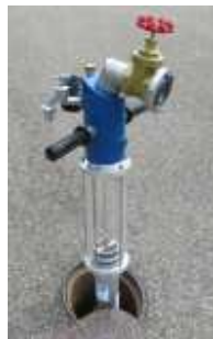
Glasnost Standrohr mit Durchflussmessung und Schauglas