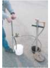
Predos Hochdruck- standrohr -Edelstahl-