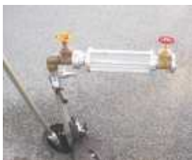
Showglas Für die Trübungserkennung