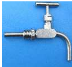
Edelstahl Probeentnahmeventil Plus mit Tauchrohr Gewindegröße 1/2"