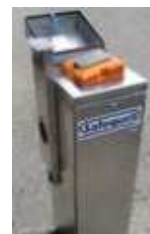
Safequell Wasserentnahme- station, Batteriebetrieb