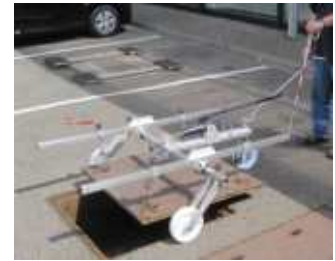
Hydrallift aus Edelstahl hebt schwere Schachtdeckel, hydraulisch bis 1500 kg / Abb. mit Längstraversen