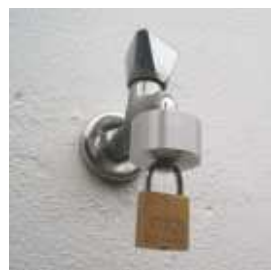
Water-close Hahnverschluß 1/2" u. 3/4" Ausführung