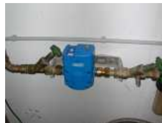
Cashflow Bargeldloser Vorkassewasserzähler Diverse Varianten