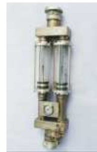
Hydrames 2-fach- Messrohrsystem für ÜH und UH -Edelstahl-