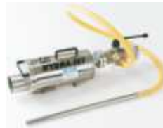
Hydrajet reinigt Hydrantenkappen -Edelstahl-