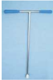
Ergoturn leichter Edelstahl Schieberschlüssel dto. als Ventilschlüssel