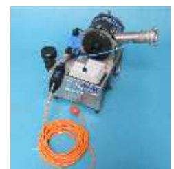
Fogsprayer mobiles Desinfektionsgerät für Wasserzähler, Schläuche, Räume