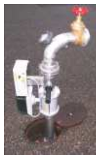
MIDlow Einfaches Spezialstandrohr mit MID- Messung direkte Ablesung