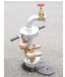
Presslow Spezialstandrohr reduziert Netzdruck