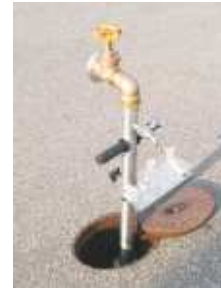
Profiprob Standrohr für Probeentnahmen -Edelstahl-