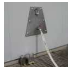
Safequell Wand-Wasser- entnahme-station