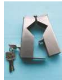
Aligator Plombierschelle für diverse Anwendungen -Edelstahl-