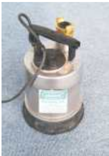
Aquawels Flachsaugende Entwässerungspumpegelenk, Stützfeder u. -Edelstahl-