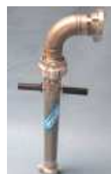
Bigflow-B Einfaches Spülstandrohr -Edelstahl-