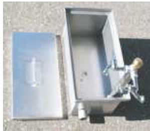
Flachzapf Unterflur-Bewässerungs- Anschluss -Edelstahl-