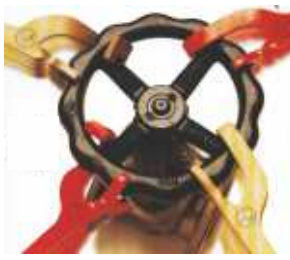
Mega Sicherheitsschlüssel Handrad-Hebelschlüssel