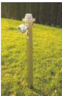
mini-ÜH Bewässerungshydrant bis 40 cbm/h -Edelstahl-