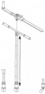
Teleskopschieberschlüssel mit Kugelgelenk-Edelstahl-