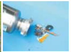
Feedback Filtratsammler mit Edelstahlfilter -Edelstahl-