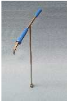
Ergoturn-Plus leichter Edelstahl Schieberschlüssel mit hochfester VA Hakenspitze