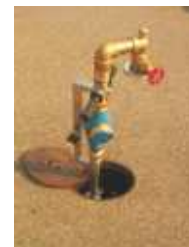
Maxiflow Standrohr für Zähler -für große Durchfluss- mengen -Edelstahl-