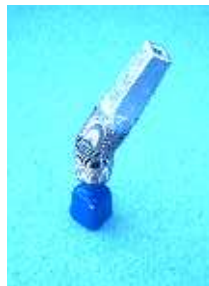
Winkelboy Adapter mit Kugel-Vierkantschoner