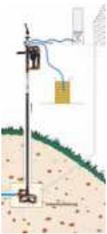
BAU-Zapf Sicherheits- Bauwasserzapfstelle -Edelstahl-