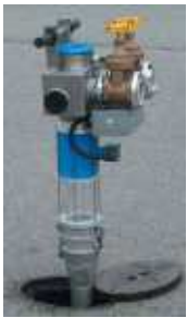
Präzise MID Durchflussprüfgerät für ÜH und UH