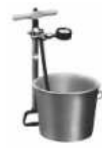
easypress presst Verstopfungen frei