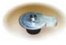
Hydrastop zur Absicherung von UH -Edelstahl-