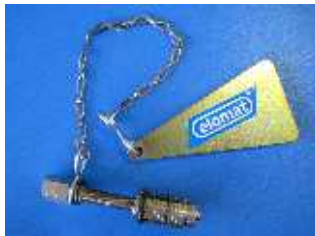
Zauberbolzen Zum minimalen spreizen von Rohrleitungen / Flanschpaare