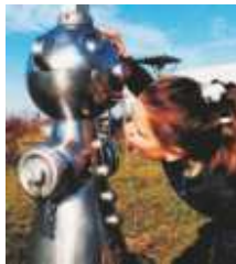
Pepino TB Origineller Trinkbrunnen -Edelstahl-