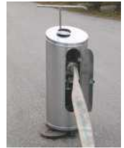
Maxitop Geschützter Anschlußpoller für UH -Edelstahl-