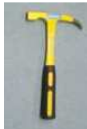
Tigerkralle mit Sicherheitsspitze