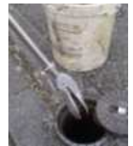
Kappenbagger Zum schnellen Ausgraben von Verschmutzungen in Straßenkappen