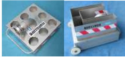
Softquell stabilisiert Schlauleitungen beim Spülen -Edelstahl-

...von elomat ® ...wir erfinden`s einfach