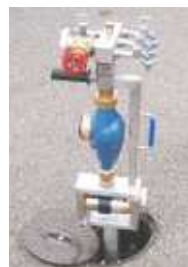
Saverpipe Sicherheits- standrohr mit Systemtrenner -Edelstahl-