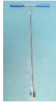
Spindelkralle für die Betätigung verrosteter Armaturen