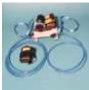
Akkudrainer Mini-Akku- pumpe für Hydranten