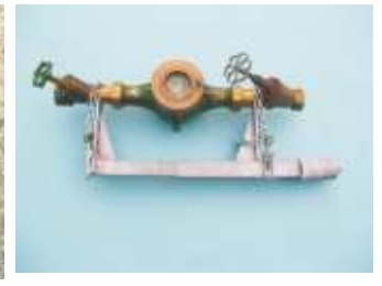
Spreizer zum Einbau und Wechsel von Wasserzählern falls kein Bügel vorhanden-Edelstahl-