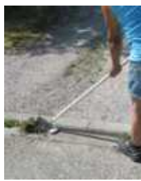
Bordsteinputzer Zum Bordsteinkanten reinigen