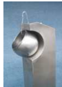
Aquapearl Trinkbrunnen mit Auffangperle -Edelstahl-