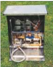
Elotop Unterflur- Multizapfstelle -Edelstahl-