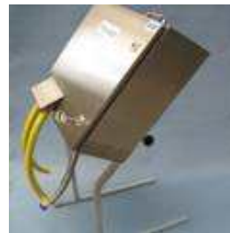
Wasizapf mobile Sicherheits- Zapfstelle, f. Bauwasser