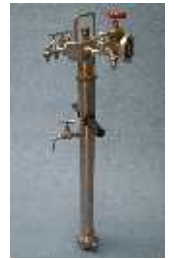
Genialo-Pipe Trinkwasser- entnahmestandrohr nach KTW