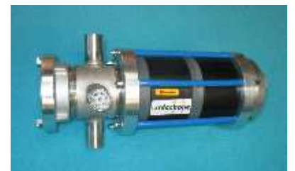
safechok Feuerwehr-Fluidcontroller Sichert leistungsschwache Löschwasserzonen im Trinkwassernetz