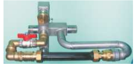
Quicktop Adapter für die Wassernotversorgung von Hausanschlüssen -Edelstahl-