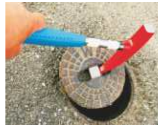
Farbiger Kappenhammer mit Sicherheitsspitze