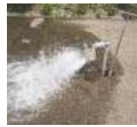
Hydrahex Spülstrom- absorber -Edelstahl-