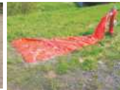
Torero Spültuch für Hydranten