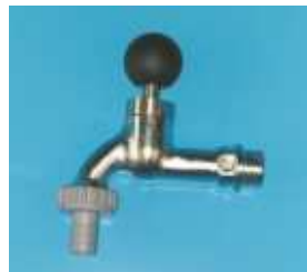
Tasti Schlauchauslaufventil mit Tastfunktion