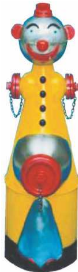
Pepino aus Edelstahl mit, oder ohne Lackierung. als funktionierender Hydrant oder Trinkbrunnen