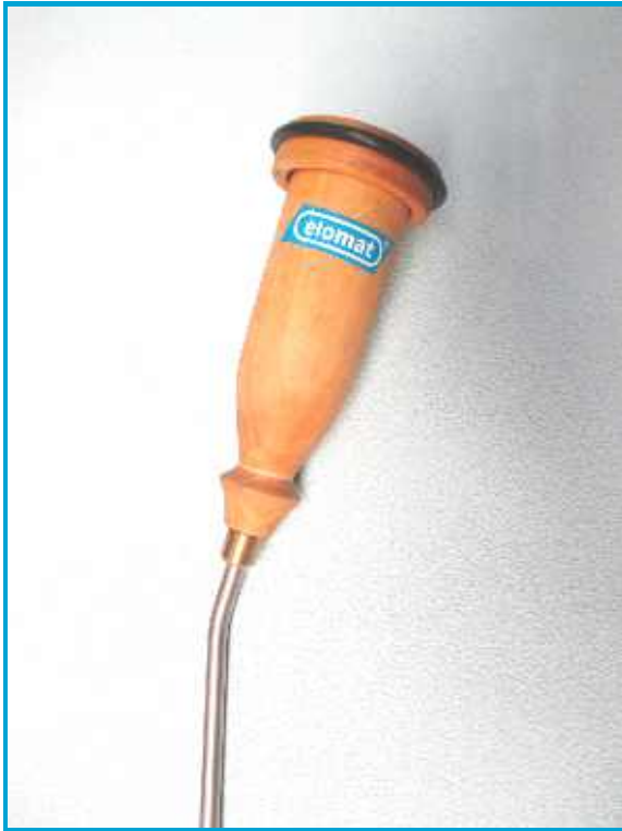
Ergonomisch abgewinkelter Taststab

Holz-Horchdose, altbewährt, von elomat neu entdeckt und verbessert. Die Holz-Horchdose von elomat besteht heutzutage aus einem resonanztauglichen, hochwertigen Gitarrenholz. Holz absorbiert zudem Nebengeräusche wie Wind, Umgebungslärm deutlich effektiver, als Metall- oder empfindliche Elektronik-Horchdosen.