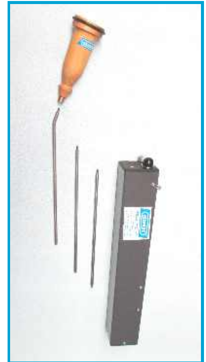
Einfache und schnelle Inbetriebnahme

Die Edelstahl-Verlängerungsstäbe sind auch kompatibel mit unserer Metallhorchdose Typ Horchi