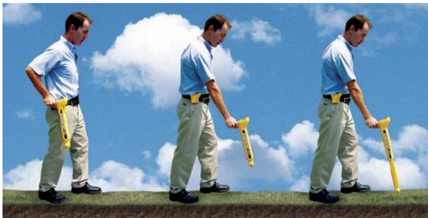
Ergonomische, praktische Handhabung