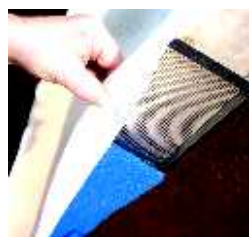
Leicht abnehmbare Filtermatten

Die effektive (vollflächige, nicht punktuelle) Absaugung mittels mehreren Filterstufen (davon zwei innerhalb der Kabine) schützt den Kunden und das Personal wirkungsvoll vor übermäßigem Einatmen der Spray-Lotion.