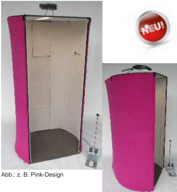
Abb.: z. B. Pink-Design

Die patente Absorber-Absaugkabine für Profis.