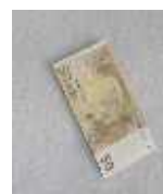
Einfacher Saugtest, Filtertest

Testen Sie uns sowie auch andere Hersteller auf die Werbeversprechen in Bezug auf Abluffilter. Nehmen Sie einen beliebigen Geldschein, und halten Sie ihn wie hier abgebildet vor den Filter. Wenn dieser an jeder Stelle (auf einer Fläche von B: 30 cm, H: 100 cm des Absaugbereiches) durch den Saugdruck hängen bleibt, so spricht man von einer effektiven Sprayabsaugung.