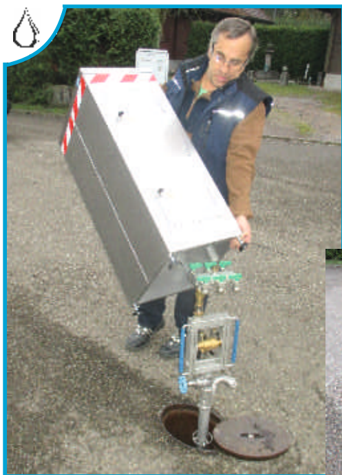
Leicht und schnell aufzustellen