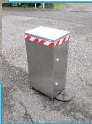
Reflektierendes Sicherheitswarnband für Nachbetrieb