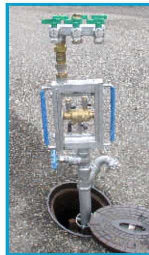
Auch kombinierbar mit dem Elomat TW-Entnahmestandrohr Super-Saverpipe mit Systemtrenner