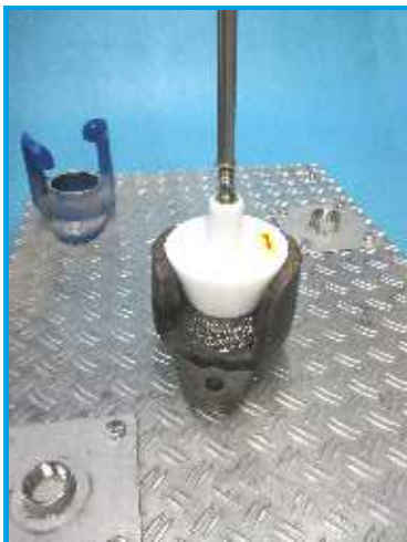
Bürste im Einsatz an Vorführmodell. Die abgefrästen Partikel werden nach außen geschleudert

Sehr oft sind angeschlossene Standrohre an Unterflurhydranten undicht, obwohl die Dichtung des Standrohres intakt ist. Die Kappe füllt sich mit austretendem Trinkwasser. Eine mit Wasser gefüllte Straßenkappe stellt ein Gefahrenpotential für das Trinkwassernetz dar. Bei einem Rohrbruch oder Feuerwehreinsatz kann Vakuum entstehen, insbesondere wenn mehrere Hydranten angeschlossen sind und dann Schmutzwasser über die undichte Dichtfläche eindringen kann. Bei Wartungsarbeiten an UH sollten die Standrohrdichtflächen prinzipiell und präventiv gereinigt bzw. nachgeschliffen werden. Bei der Feststellung von Undichtigkeit im Betriebszustand des Standrohres ermöglicht die KratzKatz einen sofortigen, schnellen und mühelosen Nachschliff bzw. Reinigung der Dichtfläche.