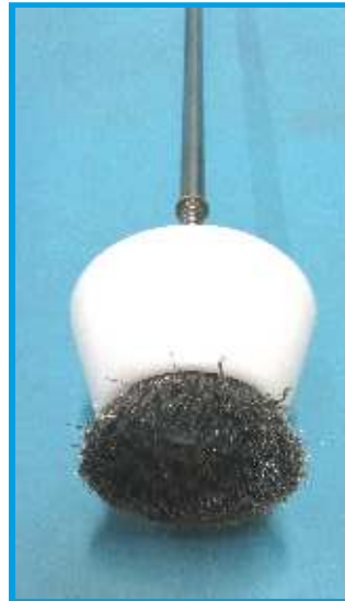
Formstabile und verschleißarme Edelstahlbürste