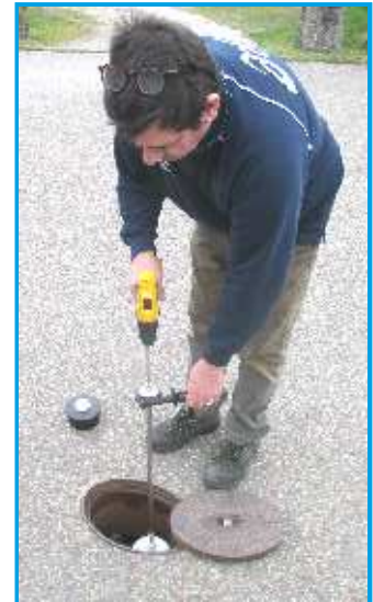
Einfaches Handling mittels Akkuschauber. Optional kann ein passender Akkuschauber v. elomat preisgünstig erworben werden.

Sehr oft sind angeschlossene Standrohre an Unterflurhydranten undicht, obwohl die Dichtung des Standrohres intakt ist. Die Kappe füllt sich mit austretendem Trinkwasser. Eine mit Wasser gefüllte Straßenkappe stellt ein Gefahrenpotential für das Trinkwassernetz dar. Bei einem Rohrbruch oder Feuerwehreinsatz kann Vakuum entstehen, insbesondere wenn mehrere Hydranten angeschlossen sind und dann Schmutzwasser über die undichte Dichtfläche eindringen kann. Bei Wartungsarbeiten an UH sollten die Standrohrdichtflächen prinzipiell und präventiv gereinigt bzw. nachgeschliffen werden. Bei der Feststellung von Undichtigkeit im Betriebszustand des Standrohres ermöglicht die KratzKatz einen sofortigen, schnellen und mühelosen Nachschliff bzw. Reinigung der Dichtfläche.