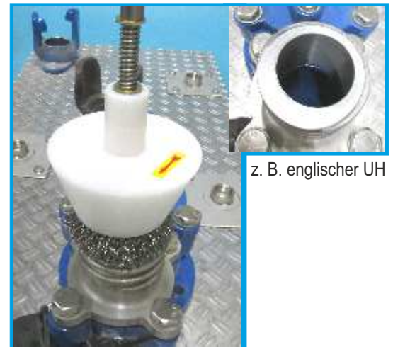
Universell auch für andere Hydrantensysteme einsetzbar