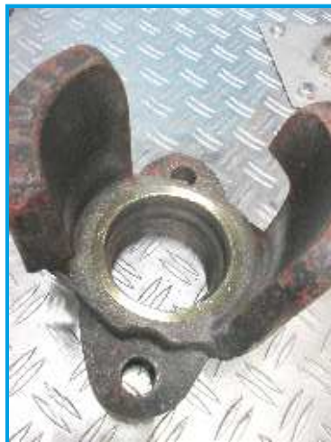
Das Reinigungsergebnis, Dichtfläche wieder intakt