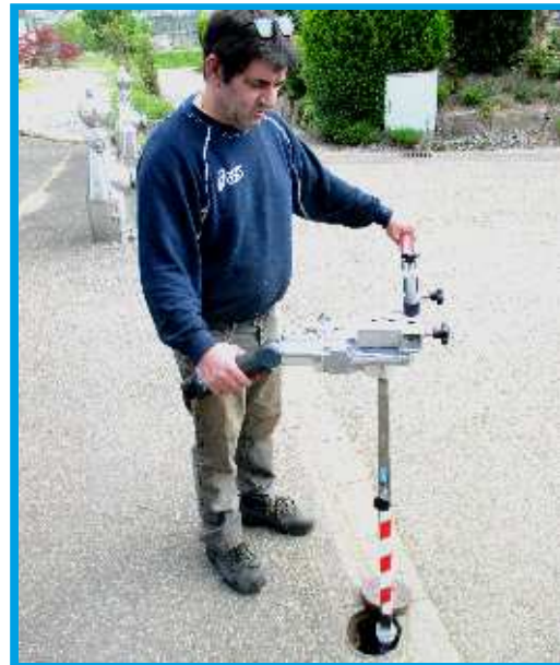
Ergonomische Bedienung, diverse Wellen und Adapter anschließbar