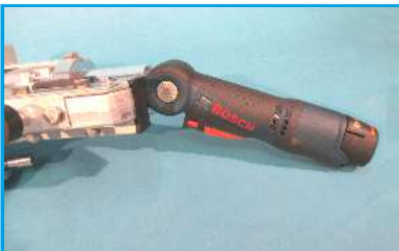
Neigbarer Griff mit „Bosch professionell Motor“